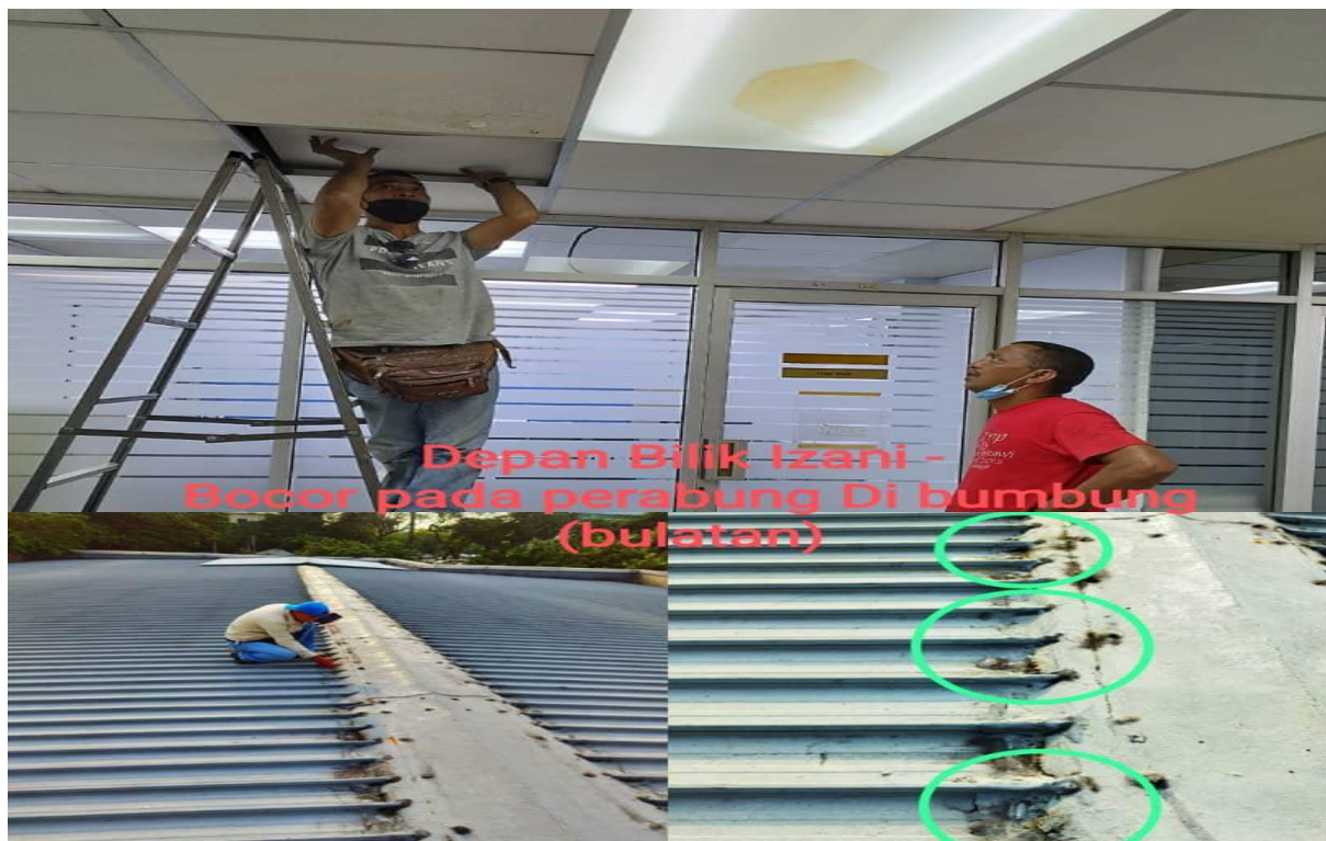
Depan Bilik Izani